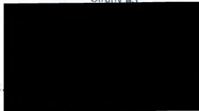
riaditeľ Mestského podniku Krásno nad Kysucou

MESTSKÝ PODNIK KRÁSNO NAD KYSUCOU, s.r.o. Struby 83